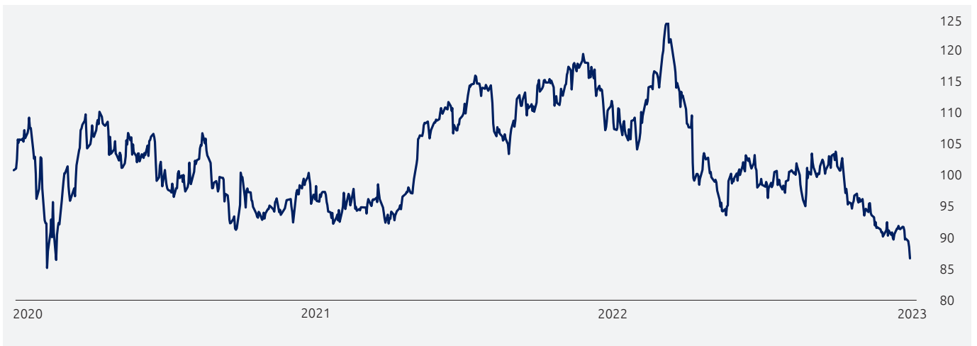
Basiswert: Swisscom (Chart ab 01.02.2020)