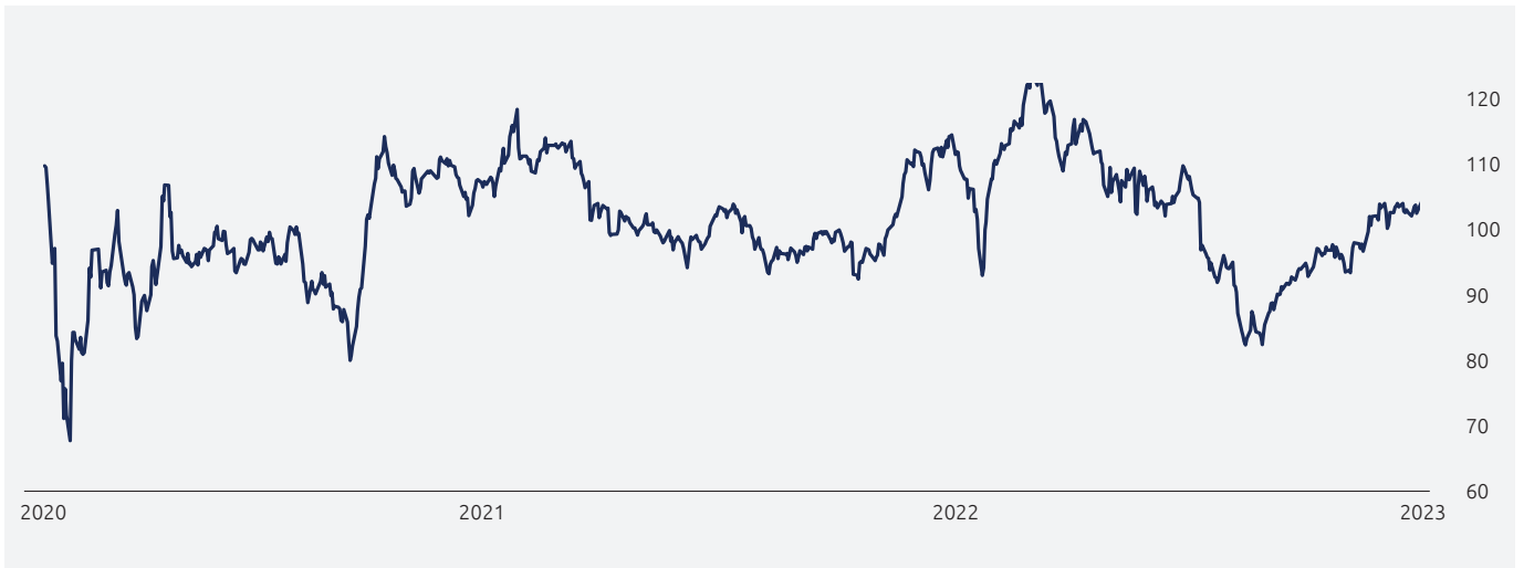
Basiswert: Novartis (Chart ab 03.03.2020)